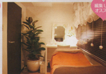
編集 U の オススメ!