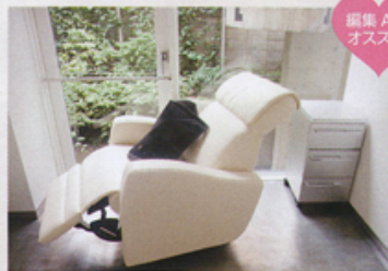
編集 A の オススメ!

圧倒的な目元カラを、24時間いつだってキープするならまつエク。お泊まりの旅行でもブ ールサイドでも、ずっとパーフェクトに美しいまま♪